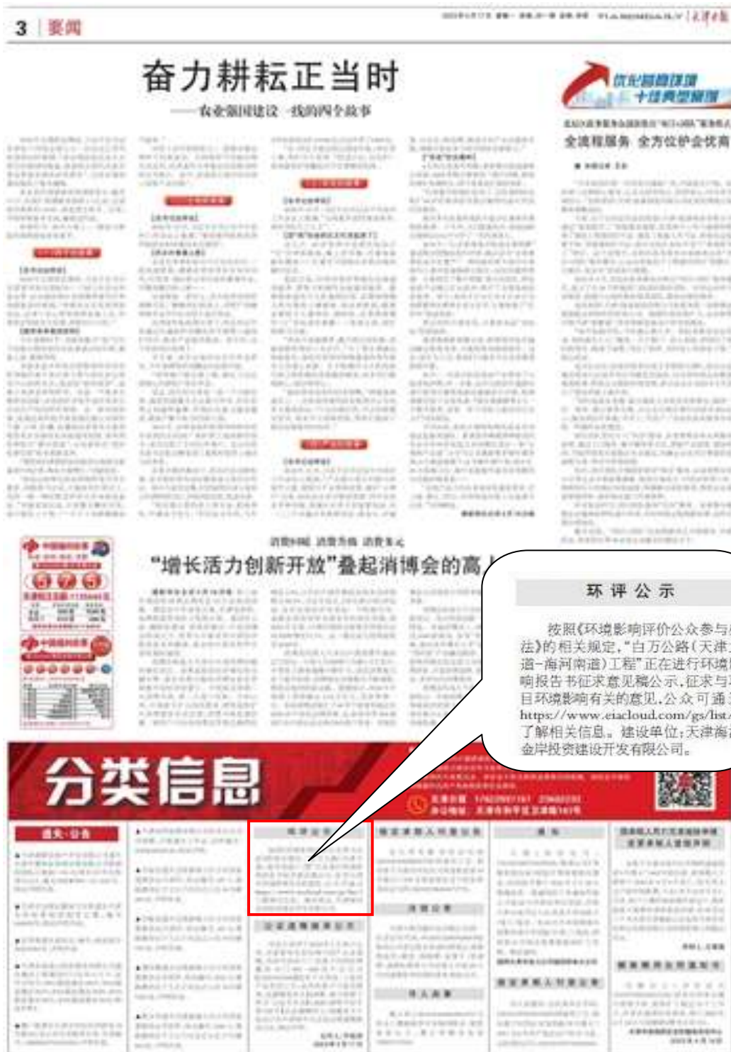
图 3.2-5 第二次报纸公示情况图 (2023 年 4 月 17 日)