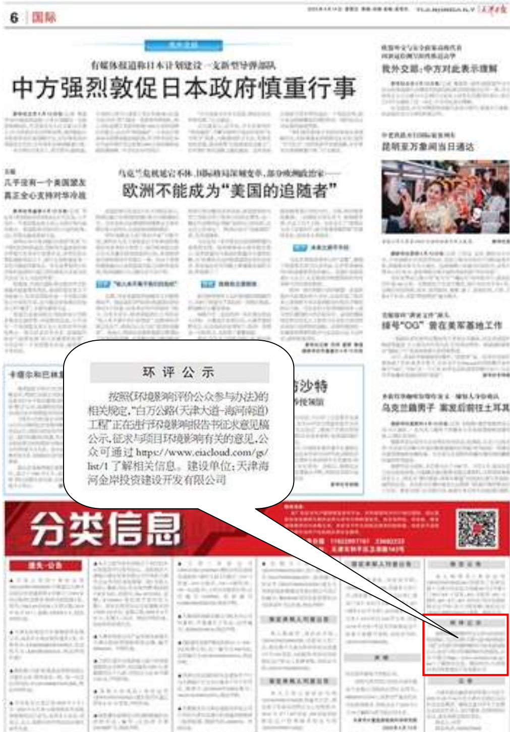
图 3.2-3 第一次报纸公示情况图 (2023 年 4 月 14 日)