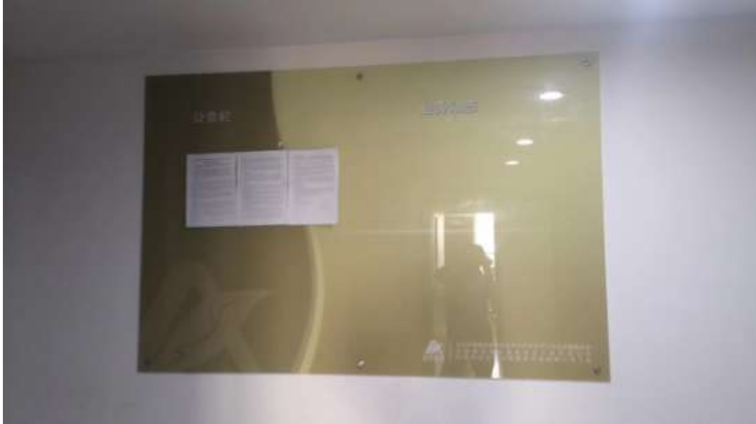
图 3.2-6 张贴公示情况图（建设单位，2023 年 4 月 12 日）

日于本单位、项目地址及评价范围内敏感保护目标处张贴公告，张贴公告的地点均为建设项目所在地公众易于知悉的场所，张贴时间为2023年4月12日至2023年4月26日，持续公开10个工作日，符合《环境影响评价公众参与办法》对建设项目环境影响报告书征求意见稿现场张贴公告的要求。公示截图如下。