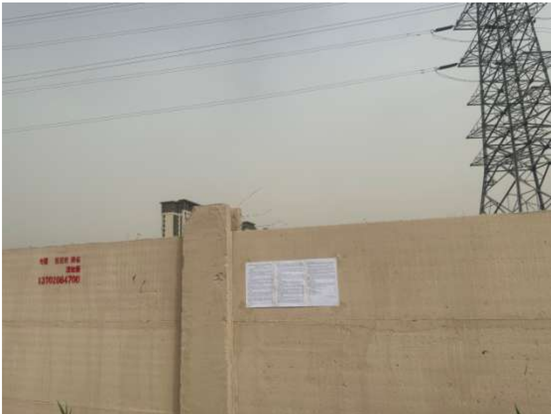
图 3.2-7 张贴公示情况图（项目地址 1，2023 年 4 月 12 日）