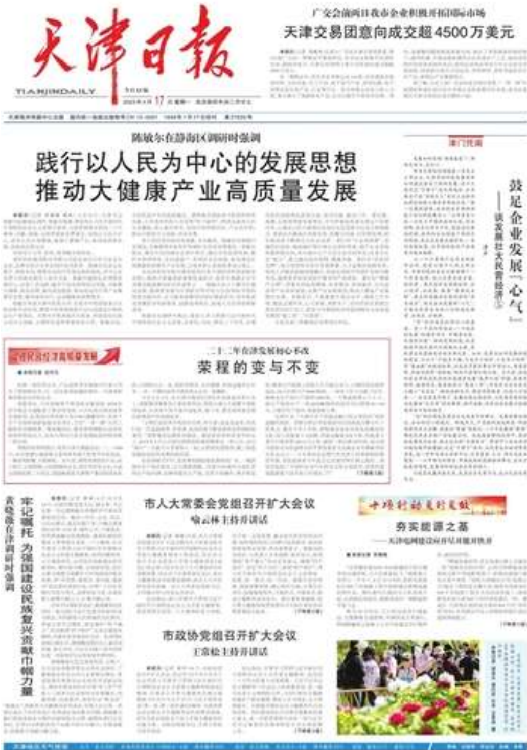
图 3.2-4 第二次报纸公示的版面（2023 年 4 月 17 日）