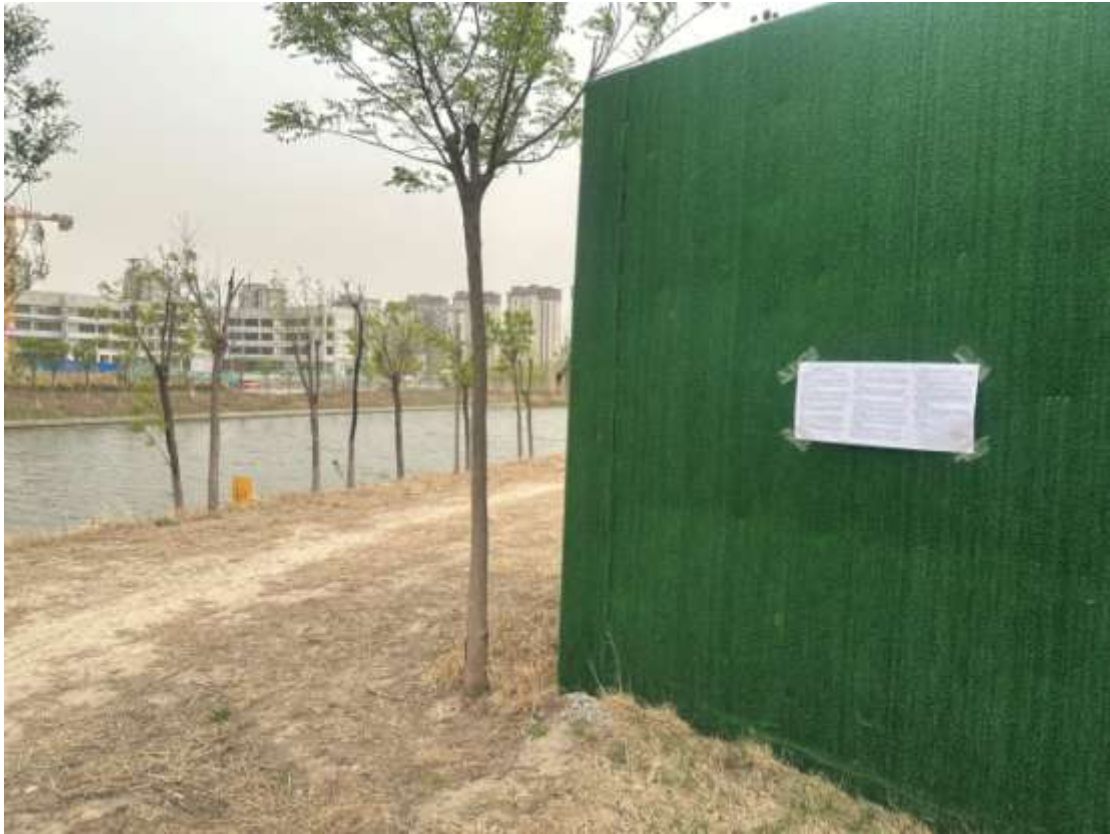
图 3.2-8 张贴公示情况图（项目地址 2，2023 年 4 月 12 日）