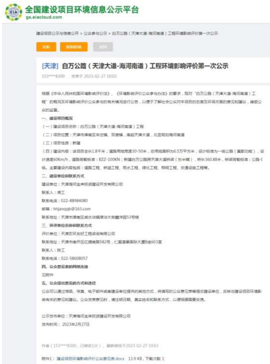
图 2.2-1 第一次网上公示截图