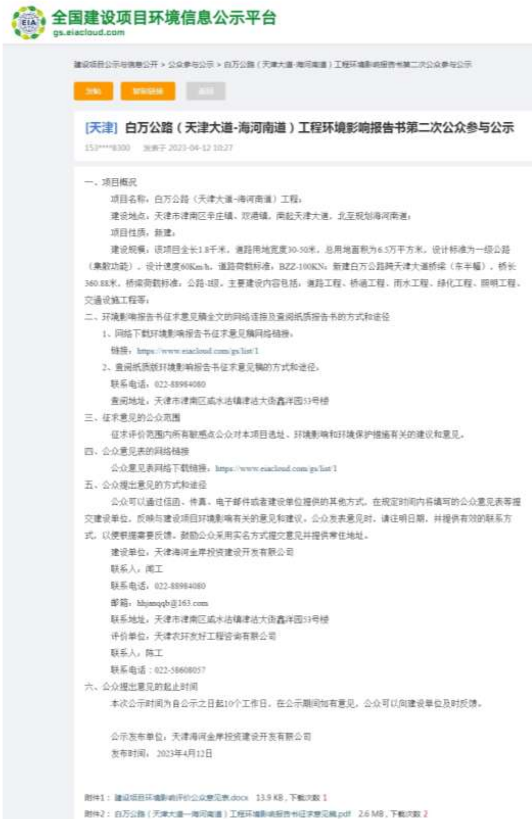
图 3.2-1 第二次网上公示截图