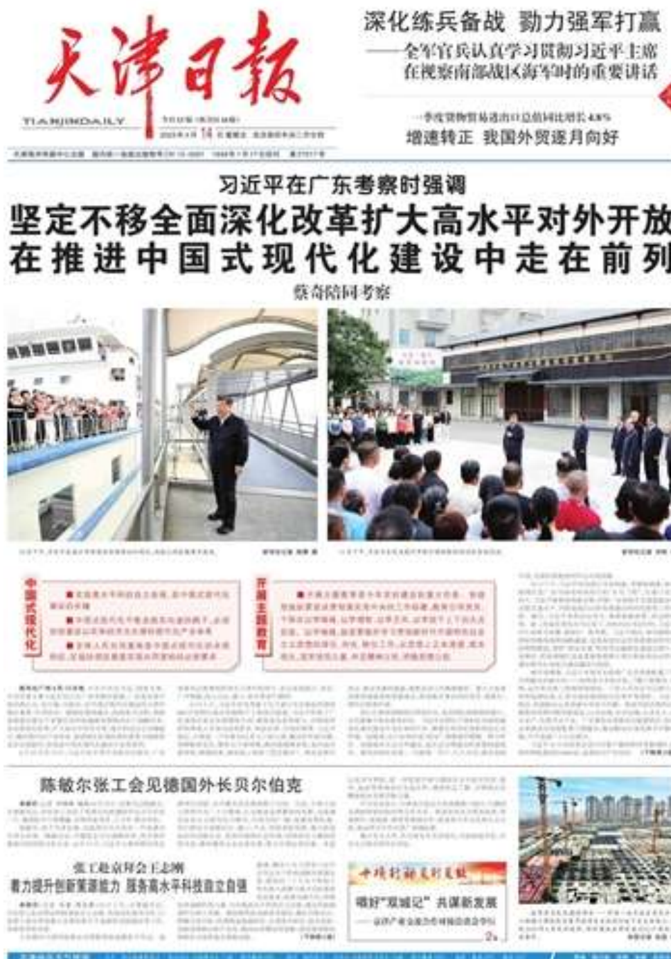
图 3.2-2 第一次报纸公示的版面（2023 年 4 月 14 日）

征求意见稿形成后，应“通过建设项目所在地公众易于接触的报纸公开，且在征求意见的 10 个工作日内公开信息不得少于 2 次”。本公司在 2023 年 4 月 14 日和 2023 年 4 月 17 日于天津日报上进行 2 次公示，天津日报属于建设项目所在地公众易于接触的报纸，报纸公示时间在征求意见的 10 个工作日（2023 年 4 月 12 日至 2023 年 4 月 26 日）内，符合《环境影响评价公众参与办法》对建设项目环境影响报告书征求意见稿公示载体的要求。公示截图见图 3.2-2~图 3.2-5。